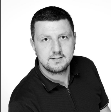
КМФ НФУМ МАКЕДОНИЈА