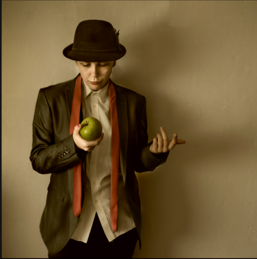
КМФ НФУМ МАКЕДОНИЈА